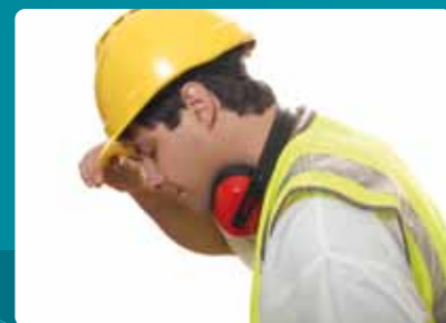
Responsabilité Civile réalisateur d'ouvrage