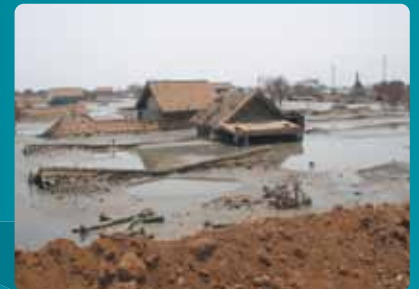
Catastrophes naturelles (cat-nat)