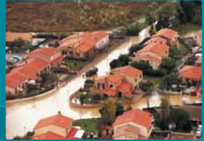
Catastrophes naturelles (cat-nat)