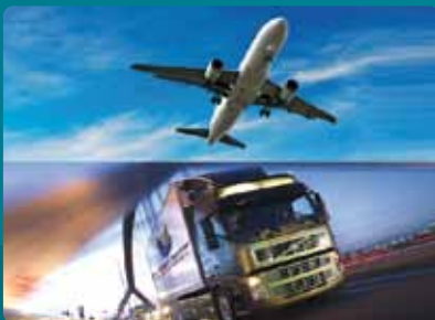
Transport maritime, aérien et terrestre des marchandises