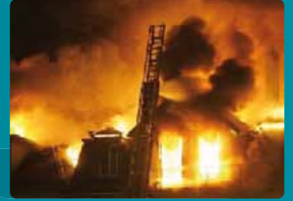
Incendie et risques annexes Pertes d'exploitation après incendie ou bris de machines