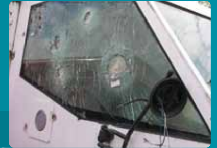
Vol de marchandises et vol en caisse