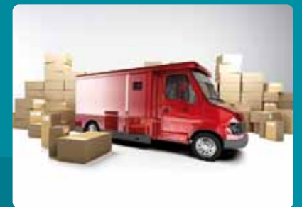
Responsabilité Civile produit livré