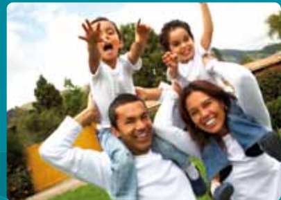
Responsabilité civile professionnelle