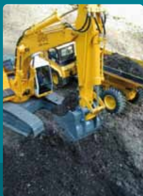
Tous risques engins de chantiers