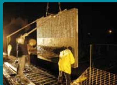
Tous risques chantier pour le génie civil