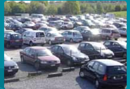
Automobile (petite ou grande flotte)