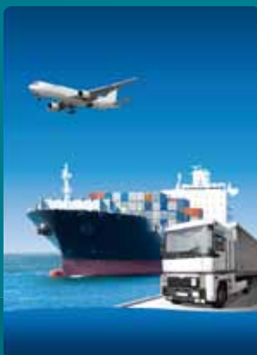
Transport maritime, aérien et terrestre des marchandises